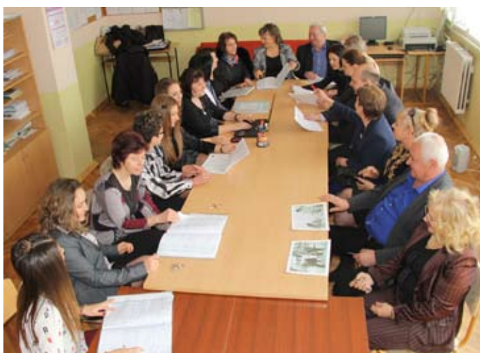
По време на оперативка в учителската стая.