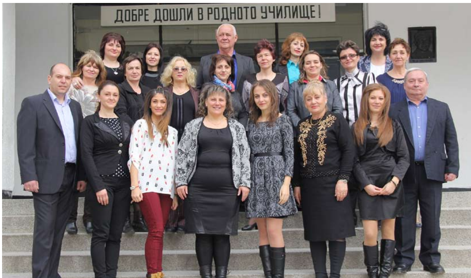
Колективът на ОУ „Юрий Гагарин“

Вие сте част от историята на едно от престижните общински училища – училище с традиции и новаторски дух. През изтеклите години, ОУ “Юрий Гагарин” се утвърждава и развива като значим образователно – възпитателен и културен център в град Смолян. На стр. 2