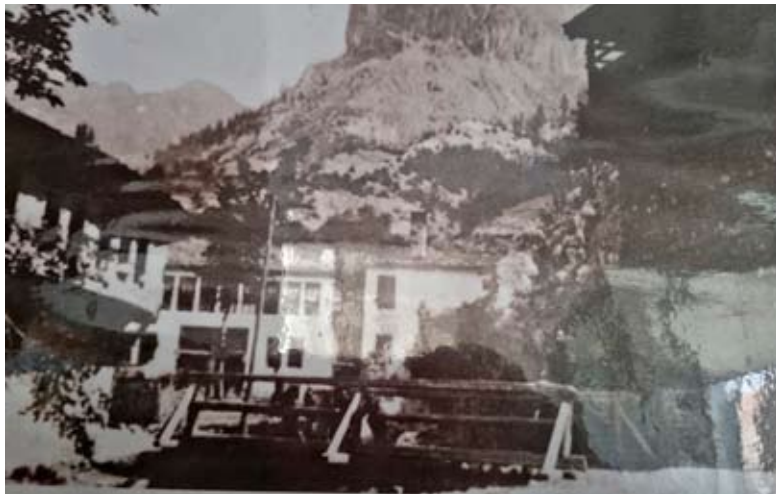
Горната махала на Пашмакли около църквата „Свети Дух“, 30-те години на XX век