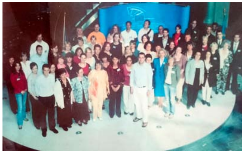
Посещение на европейския парламент