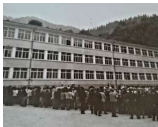
Новопостроената сграда 1974 – 1975 г.

В началото на 1971 г. започва строителството на новото крило на училището, което е завършено през 1973 г. и придава съвременния облик на сградата.