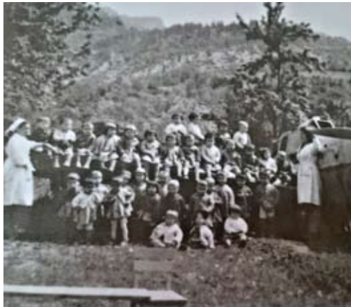
Предучилищни групи, 60-те год. на XX век

През 1902 г. турските власти предават сградата на гръцката